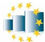
Nell-Breuning-Berufskolleg Kaufmännische Europaschule des Rhein-Erft-Kreises in Frechen

Durch die bewusste Wahl einer SiA-Ausbildung profitieren sie dabei nicht nur davon, dass sie gleich 2 Abschlüsse in 4 Jahren erwerben, sondern auch, dass sie Schritt für Schritt in das Studium hineinschnuppern können und dabei Teile des Berufsschulunterrichts als Credit Points für den Bachelor anerkannt werden. Ein besonderer Pluspunkt ist schließlich unser spezielles SiA-Coaching, auf das die Auszubildenden bei Bedarf zurückgreifen können.